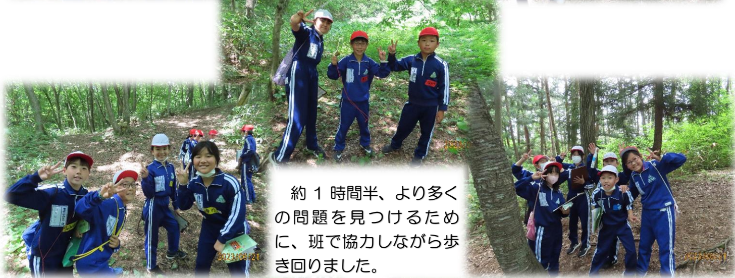
約 1 時間半、より多くの問題を見つけるために、班で協力しながら歩き回りました。