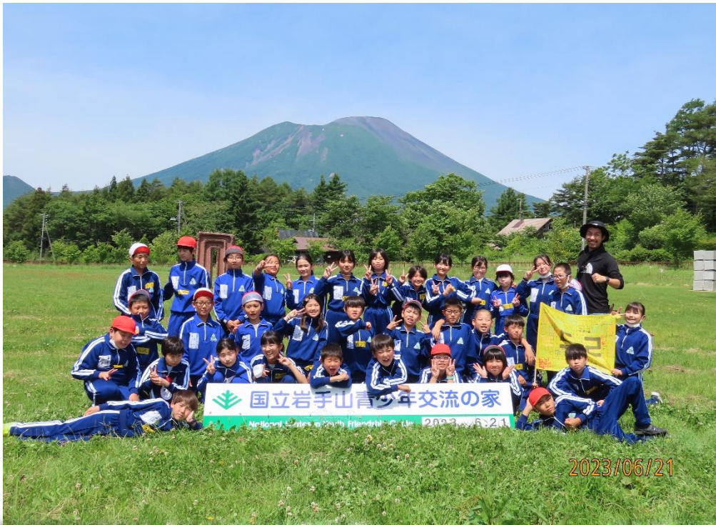
岩手山を背景に 記念撮影