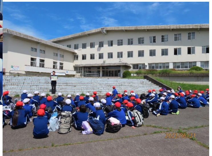
交流の家到着 オリエンテーション