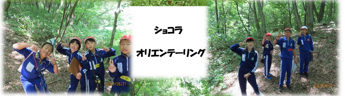
ショコラ オリエンテーリング