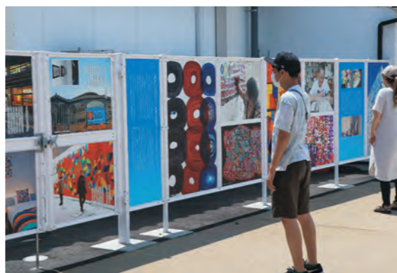
△酒匠館北側に展示しているルンビニーアート。彩り豊かな作品が見る人を楽しませます