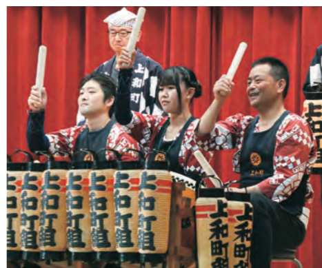
△30周年感謝祭のステージで披露した南部風流山車「上和町組」太鼓