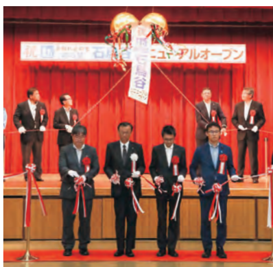
△記念式典でのテープカットとくす玉開きの様子