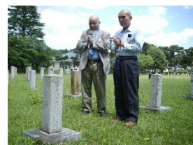
供養してきました