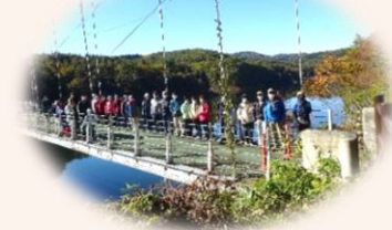
R4 年度さわやかウォーキング