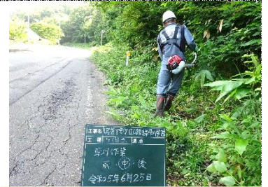
県道下宮守田瀬線 草刈り作業

草刈り作業や草集めを道路上で行っている場合がありますので、運転中の方はくれぐれもご注意ください。