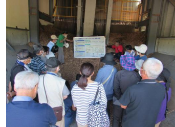
〈木質バイオマスガス化発電システム〉