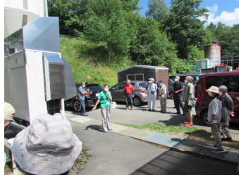
〈木質バイオマス熱利用システム〉

いるとの事でした。脱炭素社会へ向けたクリーンエネルギーの恩恵を日常生活に取り入れた取り組みを身近に実感できた学習となりました。