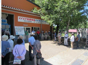
〈畜ふんバイオガスシステム〉