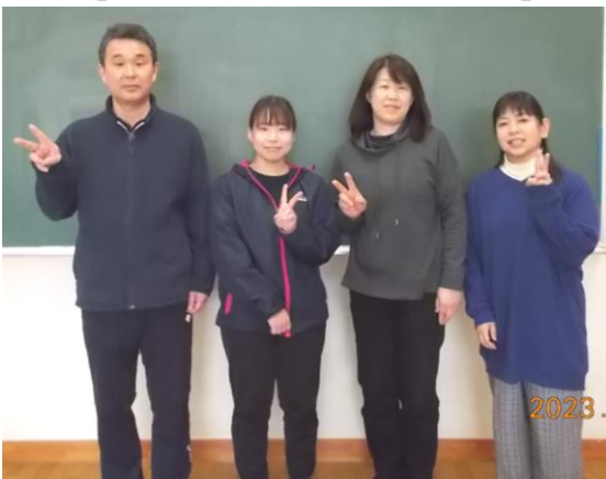
【 3 学年の先生方 】