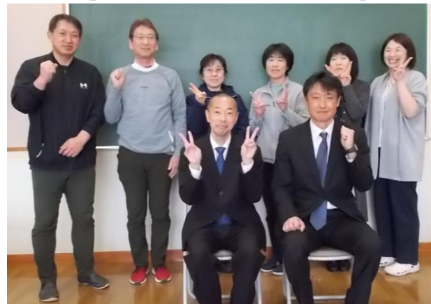
【 学年外の教職員 】