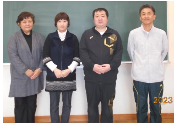
【 2 学年の先生方 】