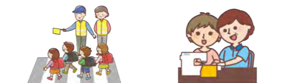
▲登下校時の見守りや家庭科のミシンのサポートなど、子どもたちのためにできることから始めてみませんか

活動や募集内容は、校報やチラシなどによりお知らせしています。興味のある人は、各学校運営協議会に配置されている取りまとめ役「地域コーディネーター」にお問い合わせください。