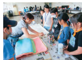
生涯学習課主催「はなまき！おもしろ探検隊」講座で和紙ランプシェードを制作する様子

夏祭りやイベントでは成島和紙のブース出展を行い、さまざまなワークショップを行いました。8月を皮切りに始まった「和紙ランプシェード講座」は、大人子ども問わず参加