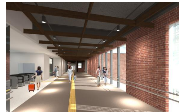
内観（自由通路・改札付近）