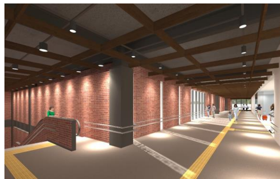
内観（自由通路・エントランス付近）