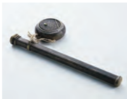
▲光太郎が携行していた矢立。小筆と墨つぼがセットになっている

手紙を通じて太田村在住当時の様子、創作活動に関わる光太郎周辺の人々との交流をたどりま