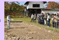
花巻城本丸跡発掘調査現地説明会