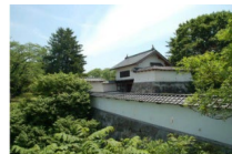
花巻城本丸西御門（復元）

花巻城は、藩境の警備のほか、和賀・稗貫2郡の行政庁としての役割があった。城下には奥州街道の整備に伴って市が開かれ、市周辺には職人たちによる町が形成されて盛岡に次ぐ大きな町となった。江戸時代中期以降、花巻城下では手工業が発達し、花巻傘や花巻人形作りが盛んになった。城下以外でも成島和紙や酒造り等の産業が発展した。