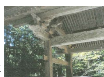
文化財への防犯カメラ設置