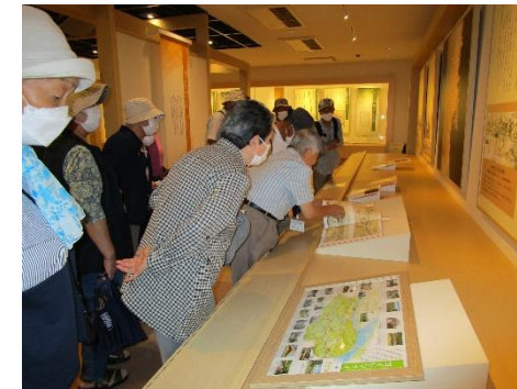
要害の役割・成り立ち等全容が紹介されている「金ヶ崎要害歴史館」内部（上）／歴史遺産として保存されている侍住宅（右上）