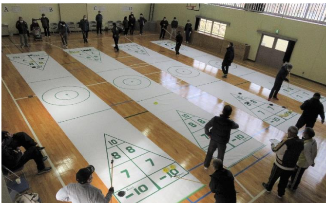
第6回シャフルボード大会順位表(敬称略)

12月3日(土)に谷内地区社会体育館を会場に第6回シャフルボード大会を開催しました。各地区から16チーム32名の応募があり、初心者から上級者まで競技を楽しみました。対戦チーム以外は審判やスコア記入をし、全員が競技に関わりながら実施でき、行政区を超えた親睦交流の場となり、珍プレー好プレーに笑いが溢れる良い大会となりました。競技結果は下記のとおりです。