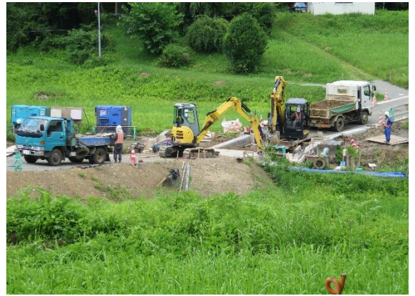
(7月6日現在の旧谷内小グラウンドと市道館迫下道線道路改良舗装工事の様子)