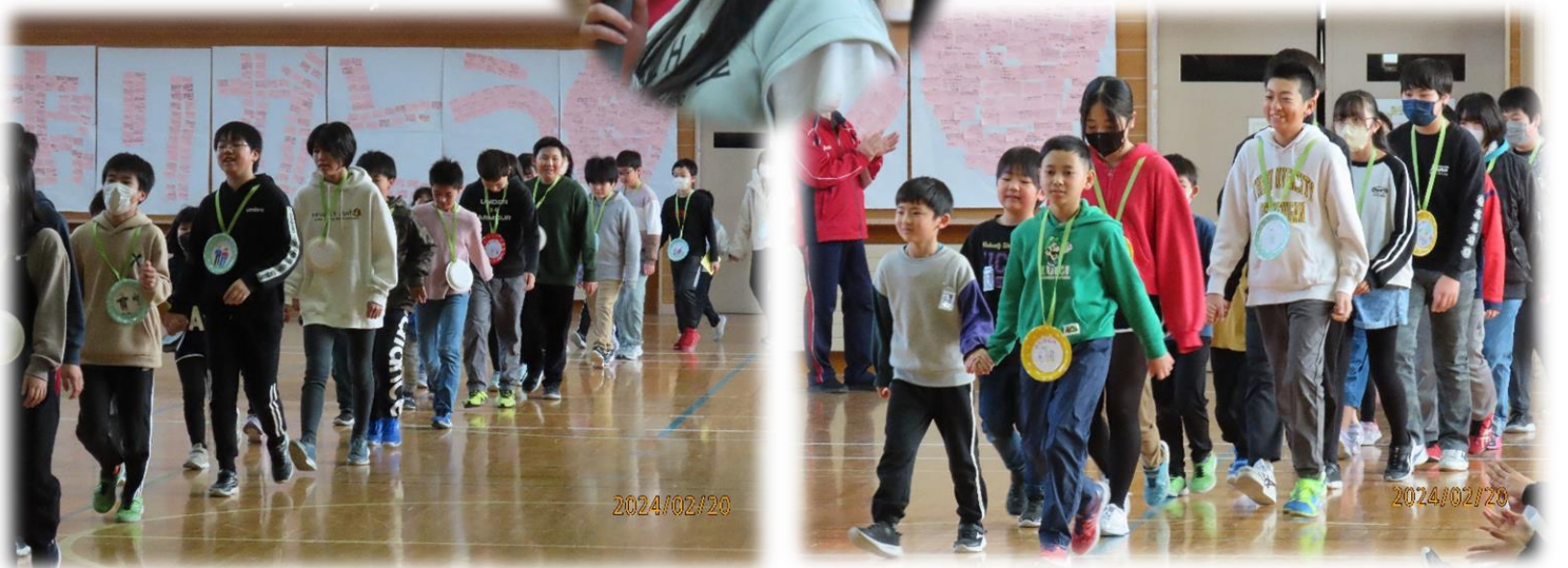
1年生にもらったペンダントを下げ、1年生と手をつないで入場。体育館後ろの壁には、5年生一人一人が書いたメッセージカードでありがとうの文字が飾られました。