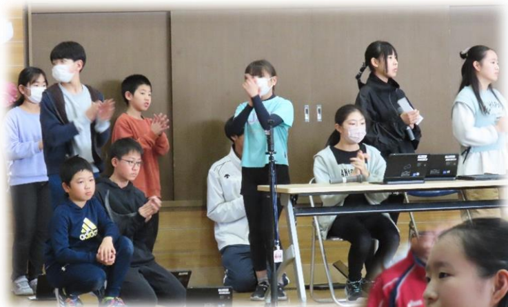
5年生の実行委員の子ども達が、会を盛り上げようと頑張りました。