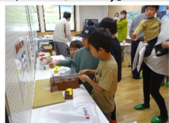
東和電力所ブース