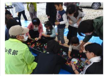
スーパーボールすくい