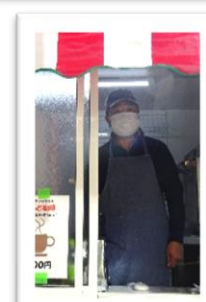
やなのうえキッチンカー