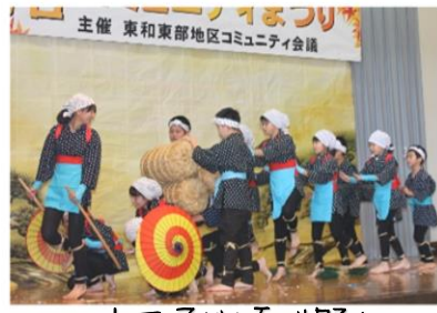
立石子ども百姓踊り