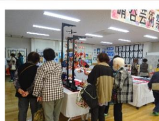
300点の作品を一堂に展示