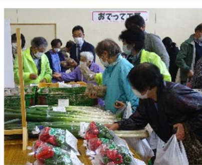
農家組合による農産物販売