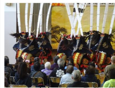
金津流丹内獅子舞