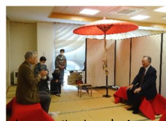
東和町茶道研究会コーナー