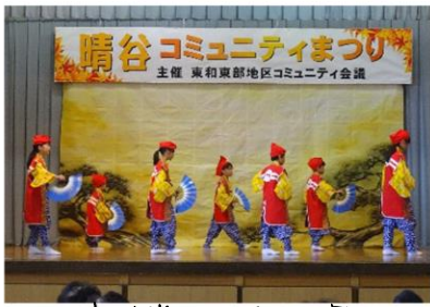
鷹巣堂大神楽松の舞

コロナ禍を超えて4年ぶりの開催となった第14回晴谷まつりが無事閉幕となりました。多くの来場者で賑わい、たくさんの笑顔が見受けられ成功裏に終了することができました。ご協力いただいた皆様、ご来場いただいた皆様、誠にありがとうございました。