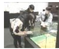
学芸員の説明を聞く