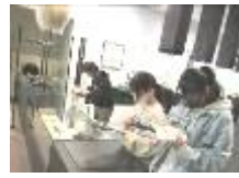
学習ガイドを使って調べる

実物を見ながら、学芸員の説明を聞いて学習ができます。学習ガイドを使った学習も可能です。