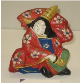
わらべさんばそう (童三番叟)