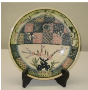
らくやきえんぎはなもんざら (楽焼縁起花文皿)