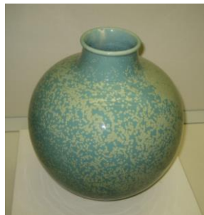
ぬかせいじゆうかびん (糠青磁釉花瓶)