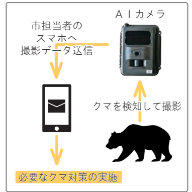
■AIカメラを活用したクマ対策のイメージ

市では、本年度から新たに、市街地へのツキノワグマの誘引物となりうる、不要なカキヤクリの木の伐採に対する補助金を創設します。また、ツキノワグマをはじめとする有害鳥獣被害の防止策である「電気柵」の購入に対する支援を継続するとともに、市内在住の土地所有者だけでなく、「市外在住で市内に土地を所有する人」も補助の対象とします。さらに、有害鳥獣対策を実施する人員を確保するため、狩猟免許の取得費用に対する支援を継続するほか、ガンロッカー、装弾ロッカーの購入に対する支援を新たに始めます。これらの制度については、準備ができ次第、広報はなまきや市ホームページなどでお知らせします。