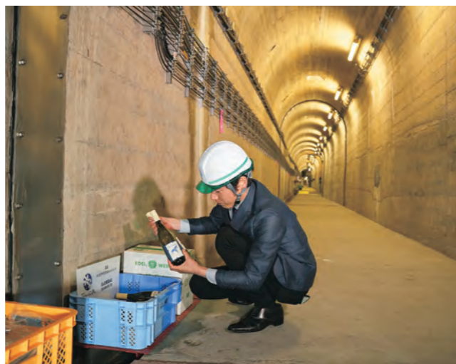
田瀬ダムの監視廊にワインを持ち込む事業者

4月11日、国管轄の田瀬ダムで、花巻市・遠野市で造られたワインを試験的に貯蔵する取り組みを開始。同日、ダムを管理する北上川ダム統合管理事務所と2市により、ダムの試行的利活用に関する覚書を締結しました。 田瀬ダム完成から70年の節目に、ダム活用による産業振興を目的として企画。貯蔵するダムの監視廊は、室温が年間を通じて11〜13度と安定しており、ワインの熟成に適した環境です。市内3社と遠野市の1社がワイン約2400本を貯蔵し、熟成させています。