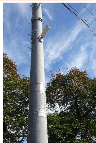
～グレーチング敷設～ ～防犯灯新設～