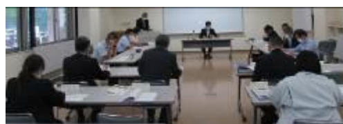
博・学連携「研究委員会」(会議の様子)