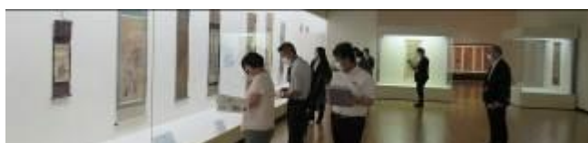
博・学連携「研修会」(テーマ展の見学の様子)