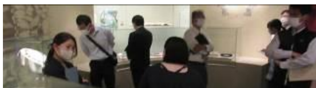
博・学連携「研修会」(常設展の見学の様子)

6月5日(月)に上記委員会と研修会を行いました。博物館と学校との連携について確認し、学芸員の解説付きで展示室を見学しました。出前授業などの具体的な内容を知っていただいた上で、博物館の持っている機能や資料を学習で活用していただきたいことをお伝えしました。