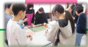
湯口小6年 1/31 水