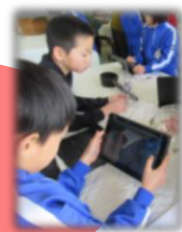
八幡小3年 2/6 火