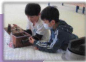
笹一小3年 2/5 月