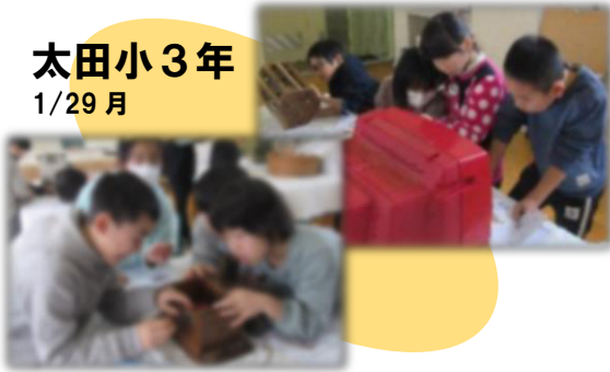
太田小3年 1/29 月