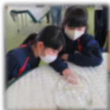
新堀小3年 2/8 木