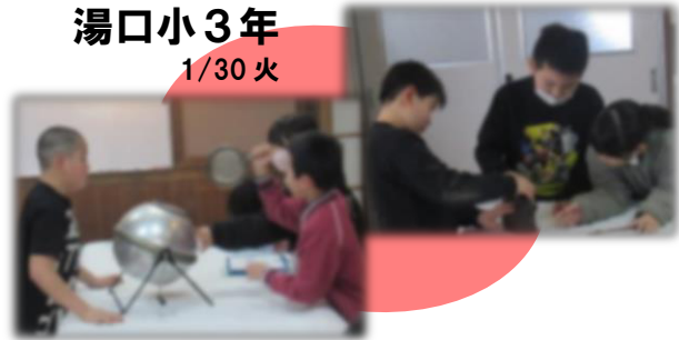
湯口小3年 1/30 火