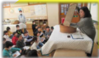
若葉小3年 2/1 木

ここからは、2月上旬の出前授業について紹介します。この期間は6校の3年生が「昔の道具と暮らし」を実施しました。やはりどの学級も意欲的に観察し発見していました（八幡小学校はタブレットの動画に声を録音するという方法でした）。