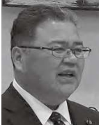
私立高校の授業料実質 無償化の影響について

県側は老朽化した現施設を他施設と集約し、高機能な体育館整備を検討する。また岩手経済同友会からは県と盛岡市に対して建設に向けた提言がなされた。本市としてはスポーツ振興や交流人口増加の寄与度に応じた財政負担の見直しなどを含め誘致活動がどのような形で進めるのかを検討する。