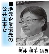
地元企業優先の 公共工事を