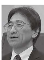
市政課題について

農村部に対する施策も併せて取り組んでいる。各種インフラの整備、自主的・地域づくり活動への支援、中山間地域への直接支払交付金制度など、地域に着目した支援を進めていく。山間集落の景観、棚田や傾斜地住宅、古い民家などで花巻の景観をつくっている。農村部などへの支援や手当てについても引き続き考えていきたい。