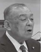
小学校学校給食 無償化について

花巻東高等学校と専修大学北上高等学校はすでに定員を確保していること、当面は定数の増員を予定していないことを踏まえると、私立高校への進学が直ちに私立高校の志望者数を大幅に減少させ、統廃合が進行することは考えにくい。しかし私立高校授業料無償化の影響による県立高校への影響が強まる可能性もある。