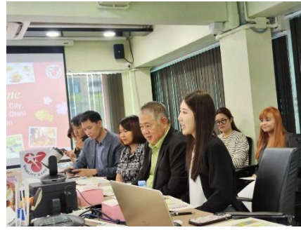
タナポン社長（前列右から2人目）