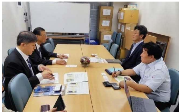
澤田支店長（右側奥）