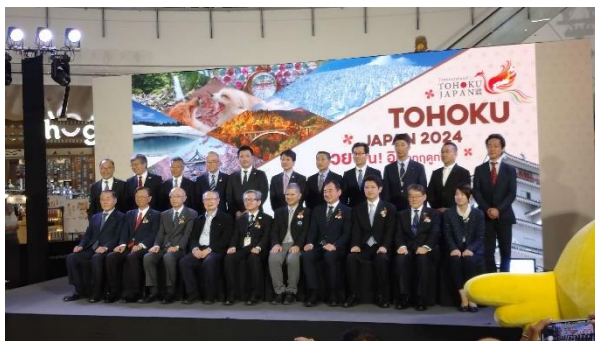
オープニング 記念撮影