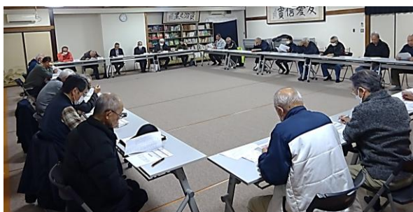
自治会長、行政区長、自治公民館長、コミュニティ会議役員が一堂に会し令和8年度の地域づくりに向けて会議を開催＝12月2日、花南振興センター