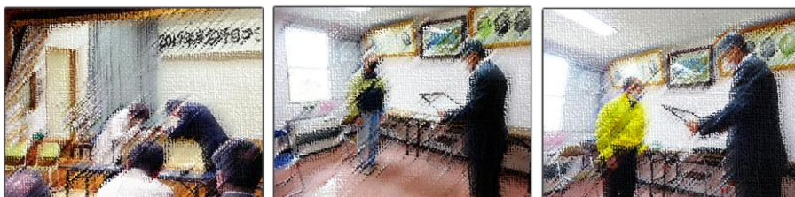
（上の3枚は過去の善行表彰の写真）

（尚、既に国・県・市町村・その他の団体等から表彰を受けている人は推薦の対象とはなりませんのでご了承ください。）