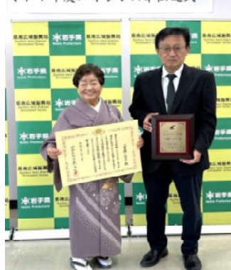
令和7年度エイジレス章伝達式

エイジレス賞とはエイジレス・ライフ（年齢にとらわれず自らの責任と能力において自由に生き生きとした生活を送ること）を実践している方に贈られる賞です。