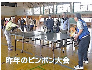
昨年のピンポン大会