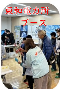
東和電力所 ブース