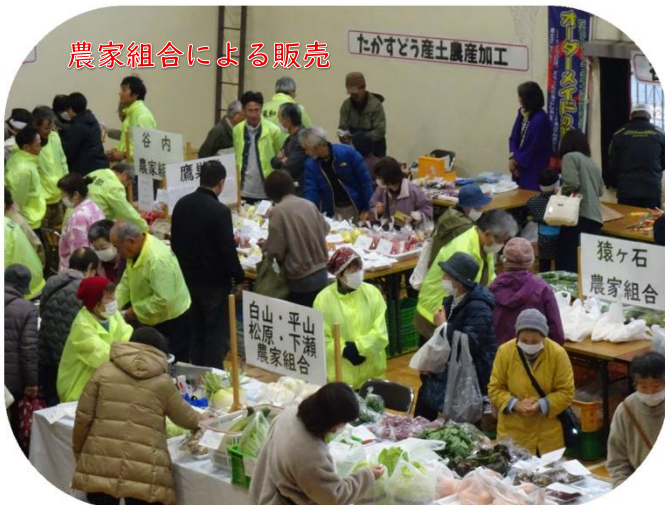
農家組合による販売