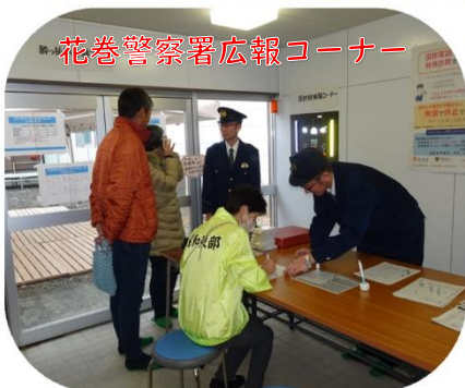
花巻警察署広報コーナー