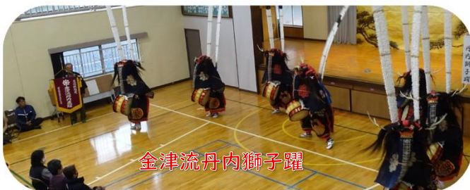
金津流丹内獅子躍