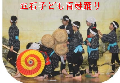
立石子ども百姓踊り