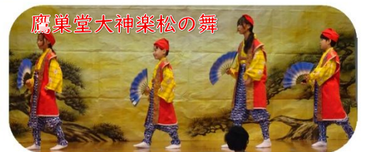
鷹巣堂大神楽松の舞