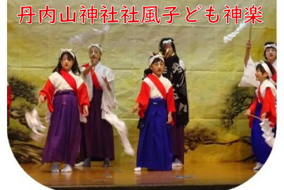
丹内山神社社風子ども神楽