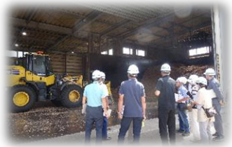
大人の社会科見学 花巻バイオマスエナジー