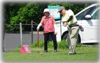
地域親睦交流 グラウンドゴルフ大会