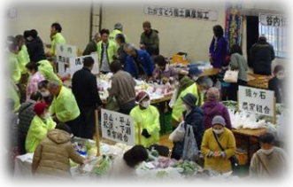
第16回 晴谷コミュニティまつり