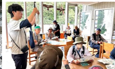
[7月15日(火) 潮風トリム～浄土ヶ浜～]