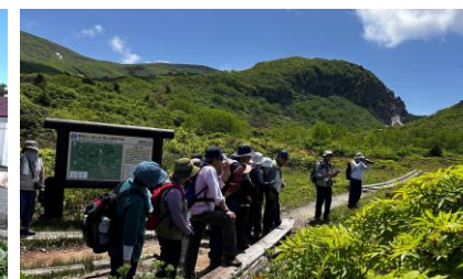
[6月13日(金) 須川湖～イワカガミ湿原～]