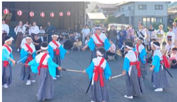
【羽山神楽保存会のシンガク】

今回の開催にあたり、準備・運営にご協力をいただいた皆様、出店にご参加いただいた皆様、そしてご来場いただいた皆様に、心より御礼を申し上げます。