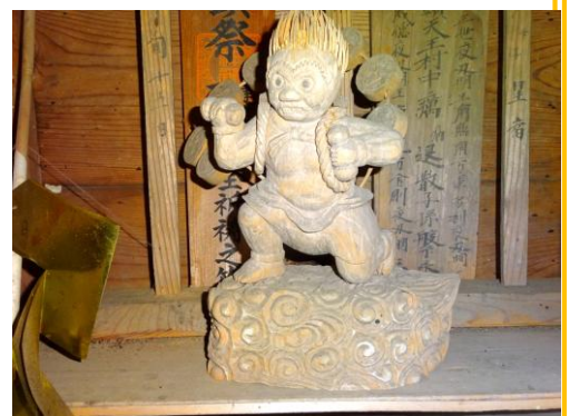
白土の天王さま 雷神が祀られています

ここには雷神（註③）が祀られています。昔、盗難に遭い、戦後に信者が寄進したものと伝えられています。