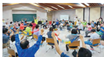
▲体操ワークショップの様子