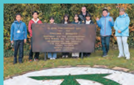
▲ベルンドルフ市派遣の様子