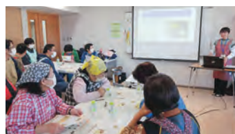
▲料理ワークショップの様子

毎年、障がいのある人を対象とした、スポーツや芸術、音楽活動、生活技術などを学ぶためのワークショップを企画しています。ワークショップでは、参加者と市内の学生ボランティアとの交流なども行っています。