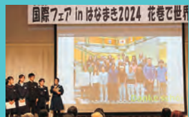
▲昨年の発表の様子

本市の国際姉妹都市など(米国ホットスプリ ングス市・ラットランド市・クリントン村、オース トリア共和国ベルンドルフ市)から帰国した中 学生が、研修成果を発表します。