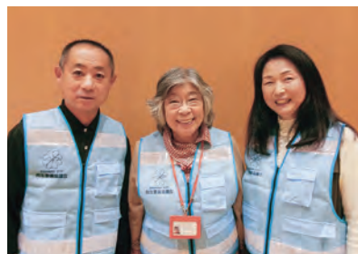
▲花巻北地区の民生委員・児童委員

本市では145人の委員が再任、87人の委員が新たに委嘱され、計232人(うち主任児童委員25人)が市内各地区で民生委員・児童委員として活動します。