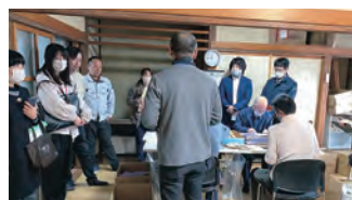
▲企業と就労支援との架け橋ツアーの様子

昨年度は「企業と就労支援との架け橋ツアー」を開催しました。企業担当者が市内の就労支援事業所を見学し、雇用時の支援アドバイスなどを受けることで、企業側が障がい者雇用を具体的に考えるきっかけとしていただきました。