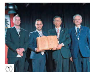
①ベルンドルフ市からの記念品贈呈(60周年記念式典)②ベルンドルフ市民劇場訪問