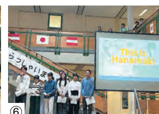
③ホットスプリングス市(学校訪問)④ラットランド市(ハロウィン参加)⑤クリントン村(州議事堂訪問)⑥ベルンドルフ市(プレゼンテーション)