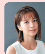
やすだ みさこ さん 安田 美沙子さん