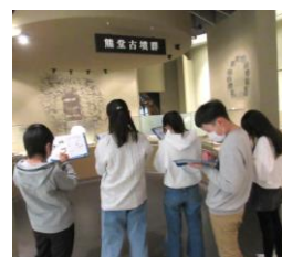
各自で問題を解く