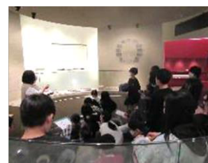
学芸員の解説を聞く