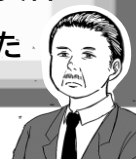
菊池忠太郎(漫画資料)

令和6年度に開催した 賢治ゆかりの東和の偉人 菊池忠太郎の生涯 の資料が 図書館に所蔵されました