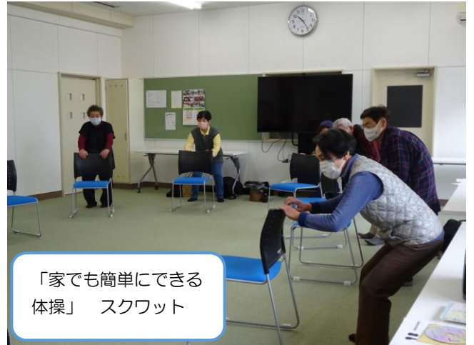
「家でも簡単にできる体操」スクワット

最後の回には交流の場を持ち、今回の反省や今後について意見交換しました。その時にアンケートのご協力をいただきましたが、・楽しかった・回数が少ない・来年もやりたいなど嬉しいご意見をたくさんいただきました。家でも簡単にできる体操については「2つぐらいは毎日、やっている」という回答がありました。