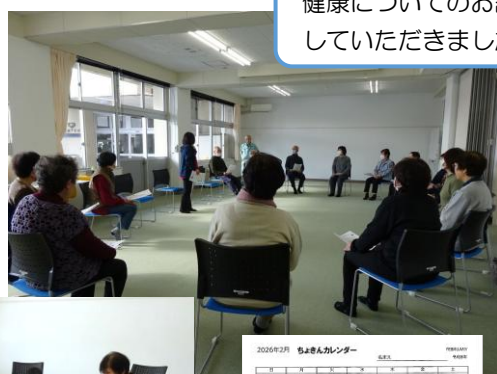
健康についてのお話もたくさんしていただきました。