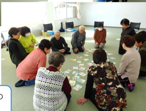
童謡カルタ 歌いながら下の句の絵札をとります。