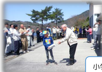
小学生の句も入選しました。