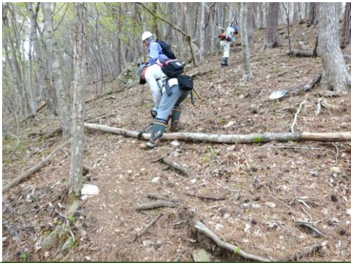
頂上付近は急斜面。作業もたいへんです。

5月27日(水)には、少し楽な作業道(木の伐りだしに使った作業道)も整備しましたので、そちらを利用して砥森山登山に挑戦してください。