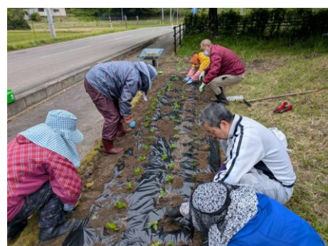
中通館跡さわやかトイレ前の花壇に花を植えました