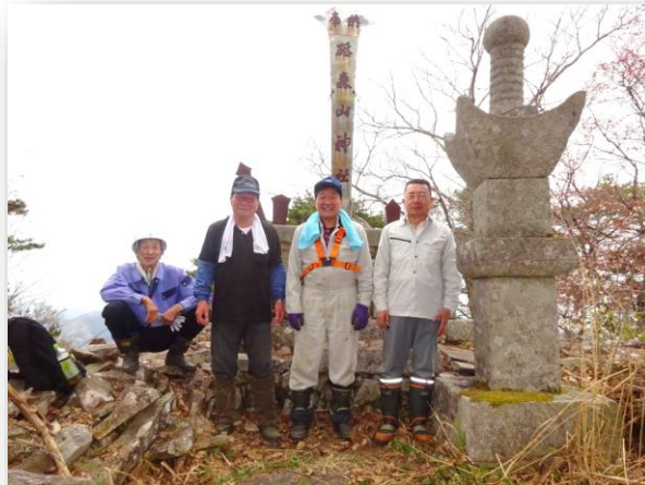
頂上の砥森山神社 で登山者の安全祈 願をしました。 登山道整備のエキ スパート。 整備の仲間募集中 です。