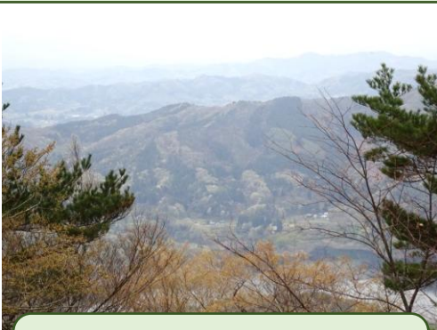
頂上の木の間から見る田瀬湖。 作業の疲れも癒されます。