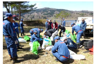
地元消防団をはじめ、地域の方々もゴミ拾いに参加しました。