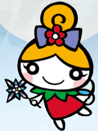
フラワーロールちゃん