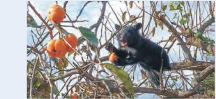
▲令和5年石鳥谷町大瀬川地区にて撮影

■補助額 。業者に委託する場合:対象経費の2分の1以内(1本当たり15万円を上限)