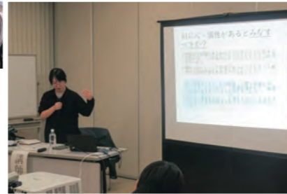
▲昨年度の様子(イーハトーブ花巻カレッジ 知っておきたいA1倫理学)