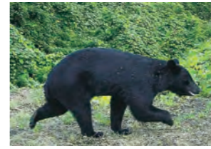
▲市内に設置したAIカメラが捉えたクマ

令和6年度から本格的に運用を開始しているAI(人工知能)カメラについて、本年度は40台増やし、計120台体制でクマの早期発見・追い払いができるよう警備体制を強化します。