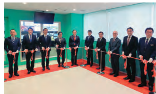
▲関係首長によるテープカット

同センターの整備により災害情報などの一元的な管理や的確な把握が可能となり、より迅速な災害対応につながります。