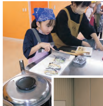
▲昨年度の様子(親子でまなぶ食育講座)