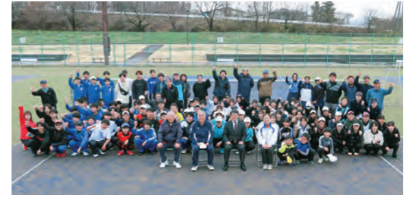
▲「市民ソフトテニス交流大会」の開会式。約100人のテニス愛好者が参加しました

リニューアルイベントとして、4月5日には「市民ソフトテニス交流大会」が、11日には「テニス教室」が開催され、多くのテニス愛好者が新しいコートの感触を確かめながら、楽しく汗を流しました。