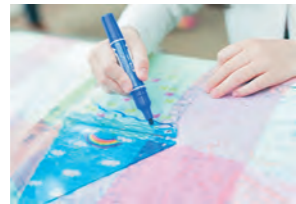
▲制作風景イメージ

7月18日(土)～10月31日(土)に宮沢賢治童話村で開催される「童話村の森ライトアップ2026」。その幻想的な世界を創