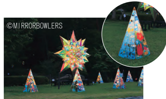
▲昨年度の展示の様子