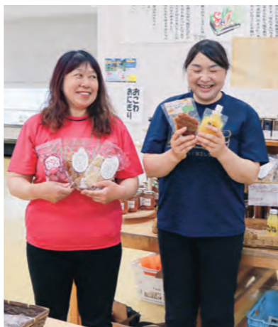
いわて花巻 UMEEGU (うめえぐ) 隊