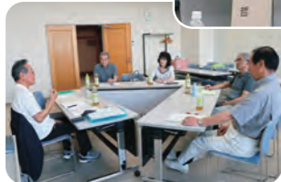
▲大学生を対象にした環境セミナーに登壇した林理事長(写真右)