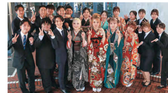
▲昨年度の実行委員会メンバー